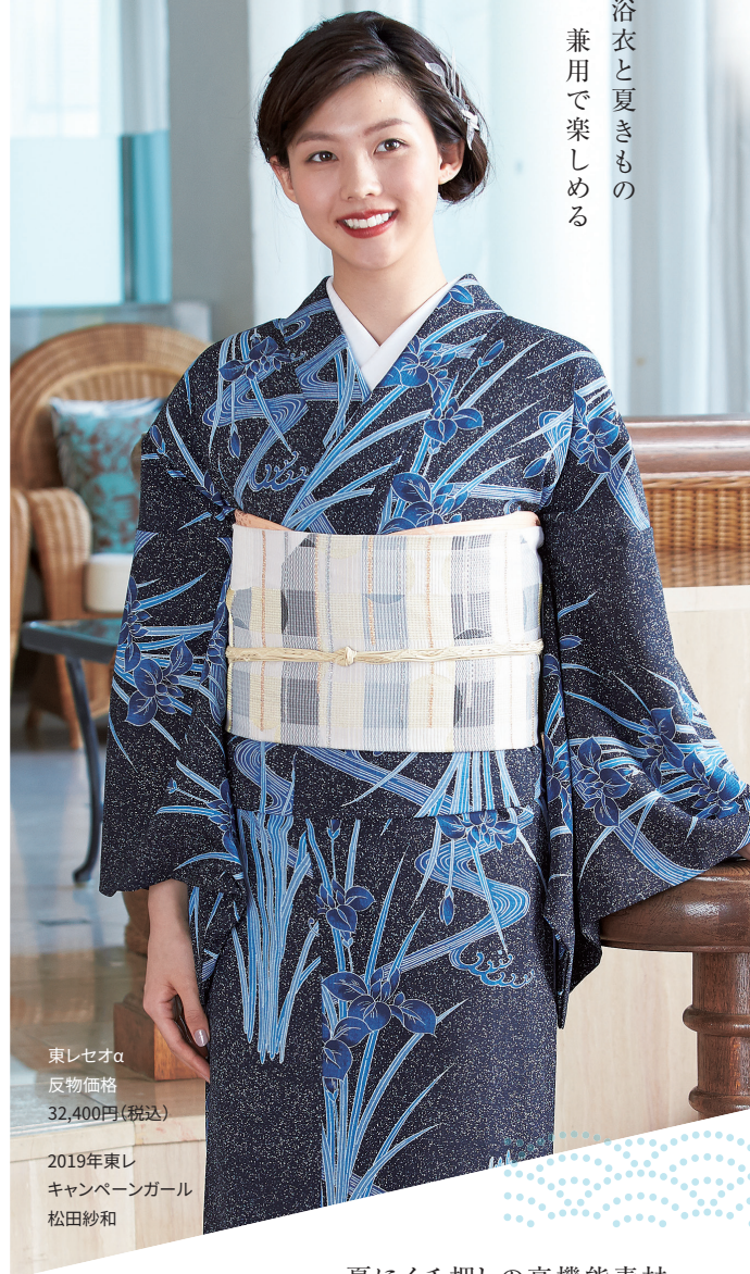
東レセオα 反物価格 32,400円(税込)