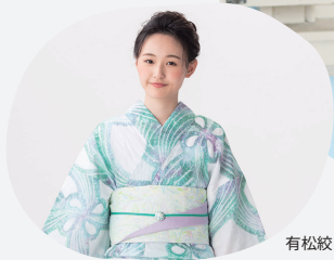
有松絞り浴衣 63,720円(税込)