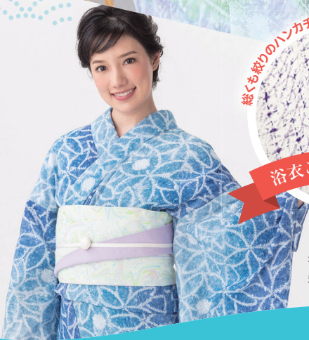
有松絞り浴衣 58,320円(税込)