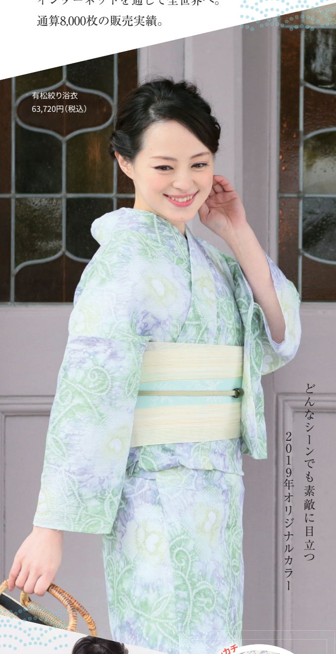
有松絞り浴衣 63,720円(税込)

1983年創業。2001年WEBショップ「つゆくさ」開設。 毎シーズン有松絞り浴衣をプロデュース。 インターネットを通じて全世界へ。 通算8,000枚の販売実績。